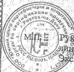
Схема сертификации 1с. Плановый инспекционный контроль - один раз в год. Зарезервировано право применения знака соответствия Системы № 00180 от 18.03.2021 г.

Руководитель (уполномоченное лицо) органа по сертификации Эксперт